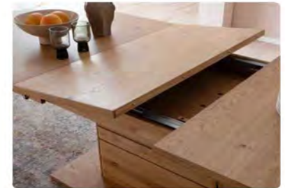
Esstisch mit Möglichkeit der Vergrößerung durch Auszug. B/H/T ca. 180(230)/77/100 cm.