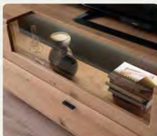
Die modernen Glasfronten bieten elegante Möglichkeiten für optional beleuchteten Stauraum.