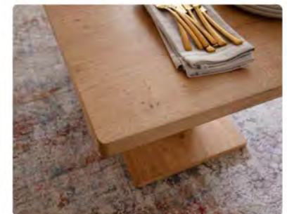
Weiche, abgerundete Ecken ergeben den letzten Feinschliff.