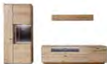
Wohnkombination 1: best. aus Typen: 12/30/50 B/H/T ca. 323/207/50 cm