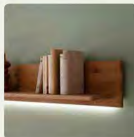
Das Wandboard eignet sich hervorragend als elegante Ablage.