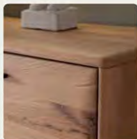
Das massive Holz mit weichen Kanten macht jedes dieser Möbelstücke zu einem Unikat für den Wohnraum.

Korpus und Front Ast/Balkeneiche massiv, durchgehende Lamelle, in Kristalleiche geölt