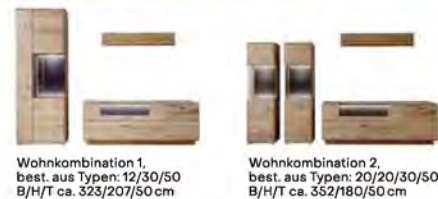
Wohnkombination 1, best. aus Typen: 12/30/50 B/H/T ca. 323/207/50 cm