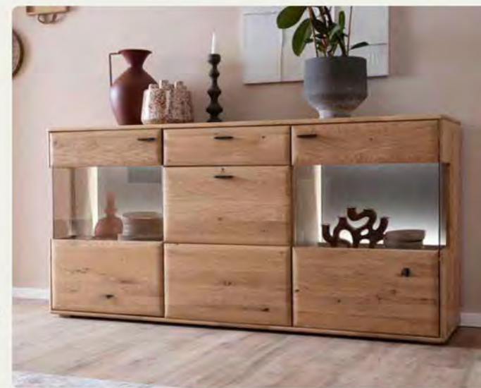
Mit viel Platz für Stauraum begeistert das MONDO Minoma Sideboard mit zwei Akzent-Türen aus Glas. Im natürlichen, harmonischen Kontrast dazu besteht der Korpus aus massiver Eiche. B/H/T ca. 184/90/44 cm.

Ob gesellige Familienessen, gemütliche Abende mit Freunden oder stilvolle Dinner – dieses Esszimmer wird zum neuen Lieblingsplatz in eurem Zuhause.