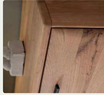
Das massive Holz mit weichen Kanten macht jedes dieser Möbelstücke zu einem Unikat.