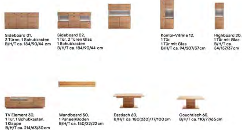
Sideboard 01, 3 Türen, 1 Schubkasten B/H/T ca. 184/90/44 cm