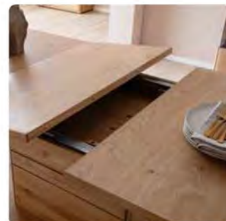
Esstisch mit Möglichkeit der Vergrößerung durch Auszug. B/H/T ca. 180(230)/77/100 cm.