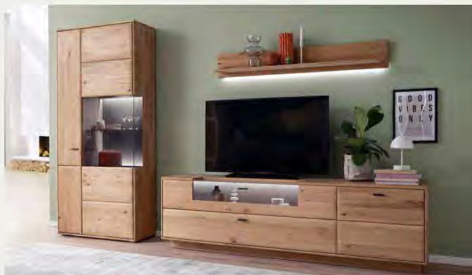
Wohnkombination bestehend aus: KombiVitrine, TV Element und Wandboard, B/H/T ca. 323/207/50 cm.

Die Massivholzmöbel von MONDO Minoma sind qualitäts- und schadstoffgeprüft. Sie werden ausschließlich am Standort Deutschland gefertigt. Das Holz dafür stammt aus bestands- gepflegter, nachhaltiger Forstwirtschaft. Hochwertige Beschläge mit integrierter Scharnierdämpfung und funktionelle Innenausstattungen garantieren einen komfortablen Gebrauch.