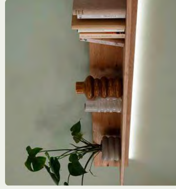
Das Wandboard eignet sich hervorragend als elegante Ablage.