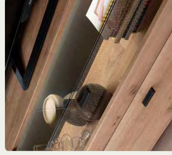
Die modernen Glasfronten bieten elegante Möglichkeiten für optional beleuchteten Stauraum.