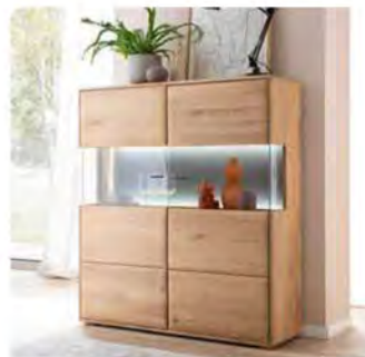
mit 2 Türen aus Holz und Glas in Parsol grau. B/H/T ca. 124/140/37 cm

NATÜRLICH WEICH MONDO Minoma bringt die Wärme natürlicher Eiche und die Leichtigkeit von Glas in ein elegantes Gleichgewicht mit zeitloser Ausstrahlung. Dank flexibel kombinierbarer Elemente lässt sich ein Ambiente schaffen, das modernes Design mit wohnlicher Geborgenheit verbindet. So entsteht ein Raum, der nicht nur stilvoll wirkt, sondern auch ein Gefühl von Ruhe und Natürlichkeit vermittelt. Passende Couch- und Esstische komplettieren das Programm.