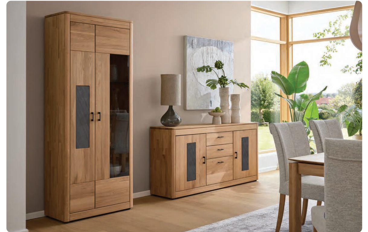
Vitrine mit 2 Türen, B/H/T ca. 84/203/40 cm. Sideboard mit 2 Türen und 3 Schubkästen, B/H/T ca. 175/86/40 cm. Frontapplikationen in Schiefer.

Charakter zeigt sich im Detail. MONDO Oreum bietet edle Akzente für euren persönlichen Wohnstil: Serienmäßig sorgt die markante Hirnholz-Applikation für natürliche Ausdruckskraft. Alternativ stehen Sägerau, glatte Eiche, Schiefer sowie Glas in Braun oder Beige zur Wahl. Passend dazu gibt es Griffe in Schwarz matt – oder optional in Silber oder Beige für eine hellere, feinere Note.