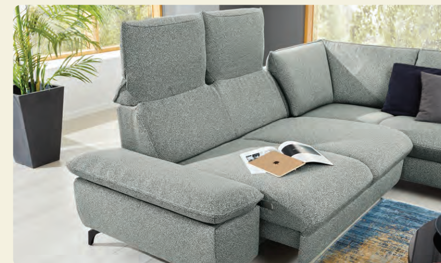
Vorziehsitze und hochklappbare Rückenlehnen garantieren individuellen Sitzkomfort.