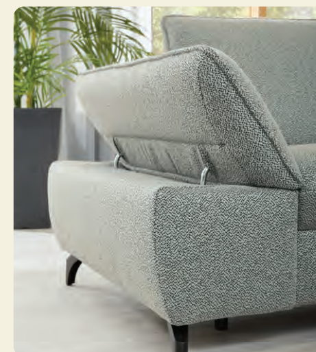
Auf Wunsch lassen sich die Armteile verstellen.