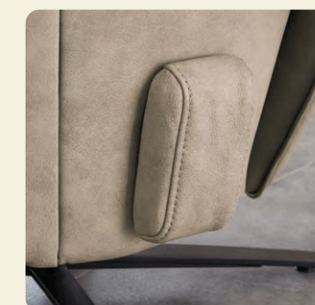
Wahlweise ist für den Akku ein passender Überzug im Bezug des Sofas erhältlich.