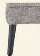
Metallfuß 982 schwarz matt