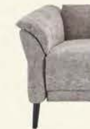
Armlehne 1 Stellbreite 18 cm