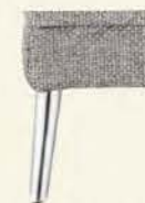
Metallfuß 980 Chrom glänzend