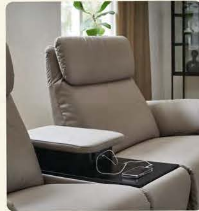
Praktisches Zwischenelement mit Tischfunktion, ausgestattet mit USB-Ladestation und Steckdose.