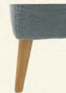
Holzfuß 1046 Eiche geölt