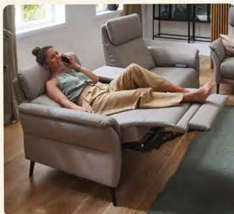
Optimale Relaxposition mit ausgefahrenem Fußteil und angepasstem Neigungswinkel des Rückens. Motorische Relaxfunktion mit Handschalter.