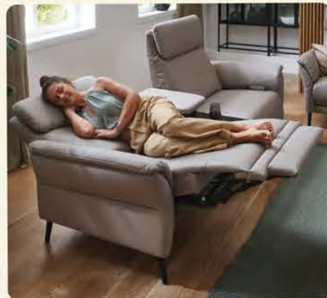
Bis zur komplett ausgefahrenen Relaxfunktion, Herz-Waage-Position. Füße und Herz haben dieselbe Höhe, dies bewirkt eine optimale Durchblutung.